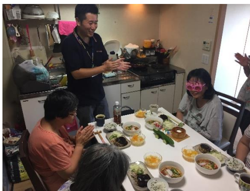
利用者・職員・実習生とみなさんでお祝いしました！

このように、誕生日会や季節のイベントを企画し、メンバーの皆さんに楽しんでいただくことで、生活の質の向上を目指しています。また、皆さんの楽しそうな様子や笑顔を見ることで私たち支援員もたくさんの元気をもらっています。次回の企画も皆さんに楽しんでもらえるような企画を考えたいと思います。